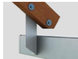
Dachsparrenmontage (bei überstehendem Dach)