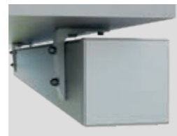
Deckenmontage (auf und unter dem Dach)

Neben der herkömmlichen Wandmontage lässt sich Kubata auch bei besonderen baulichen Voraussetzungen problemlos anbringen.